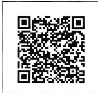
團體報名表單下載