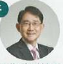
國衛院群健所 所長邱弘毅