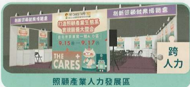
照顧產業人力發展區